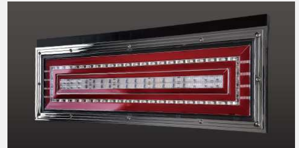
品番: OCKM-S2 シーケンシャルモデル

細部のデザインまでこだわった 究極の一体化LEDテールランプです。 ※ウインカー3分割、配線3本出し(外品リレーの 取り付けによりウインカーを流すこともできます)