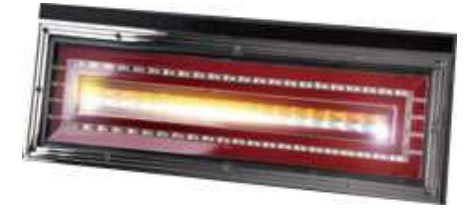
バック・ウインカー同時点灯時

バック・ウインカー同時点灯時は 下1列がバックランプ・ 上1列がウインカーで点灯。