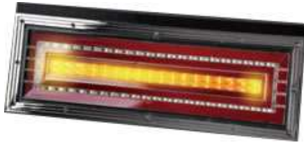
ウインカー点灯時