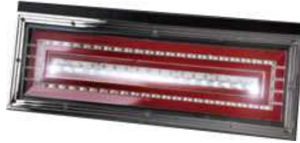
バックランプ点灯時