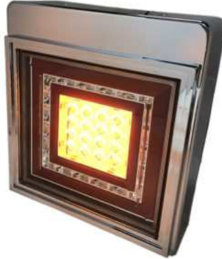
ウインカー点灯時