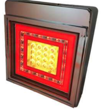
フル点灯時(ウインカータイプ)