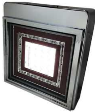
バックランプ点灯時