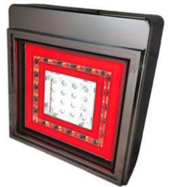
フル点灯時(バックランプタイプ)