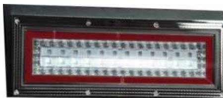
バックランプ点灯時