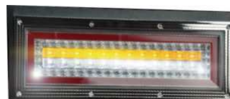
バック・ウインカー同時点灯時

バック・ウインカー同時点灯時は 下1列がバックランプ・ 上1列がウインカーで点灯。