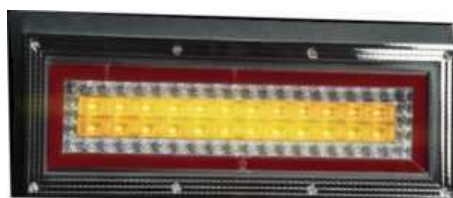
ウインカー点灯時